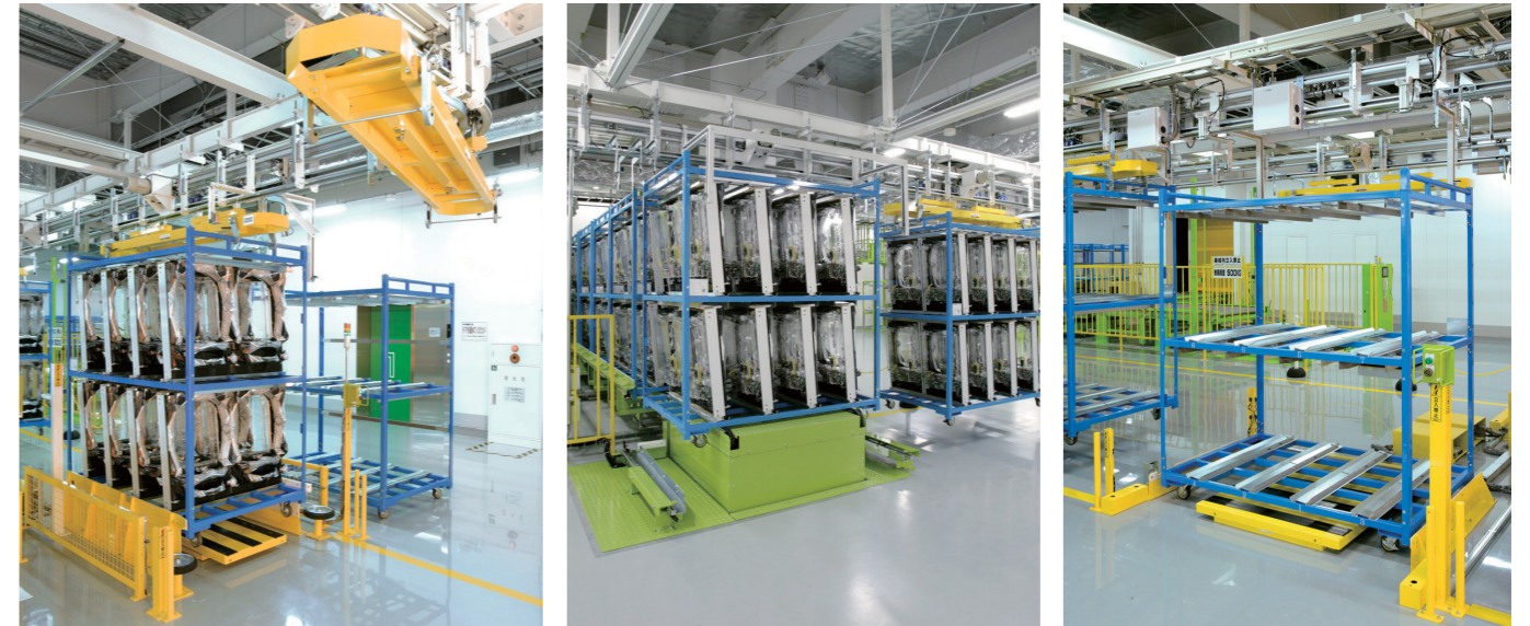
1 協力会社から納品された外枠組立品を積載した搬送台車を天井搬送システム「OCS」に移載