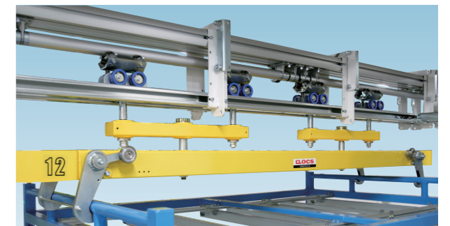
重量物搬送用のクアトロローリ(最大搬送質量 500kg)