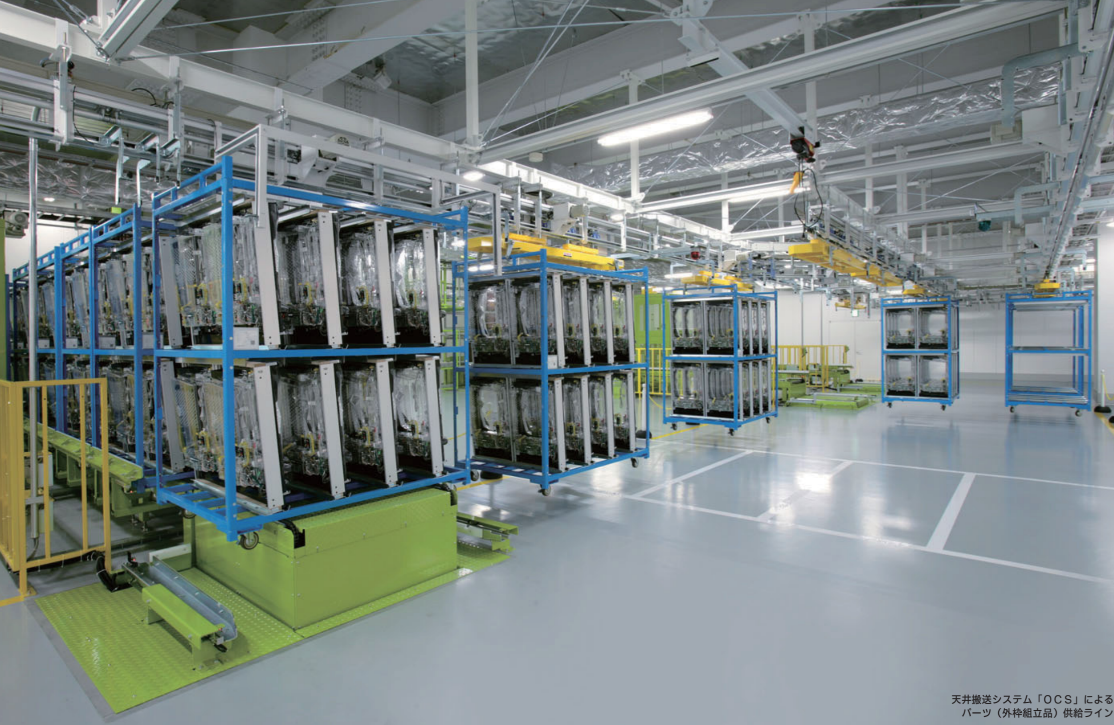
天井搬送システム「OCS」による パーツ（外枠組立品）供給ライン