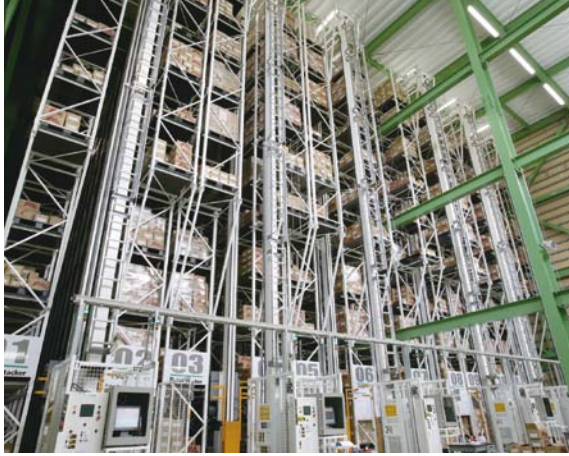
パレット自動倉庫

工場隣接の在庫保管倉庫。高さ15m、奥行35mクラスのパレット自動倉庫(パレットスタッカー)を6基導入し、3,000パレットの商品を高密度に保管しています。入庫、出庫の混雑を避けるためにステーションを別々に設け、入出庫のハンドリングは移動台車を活用することで作業の効率化を図っています。