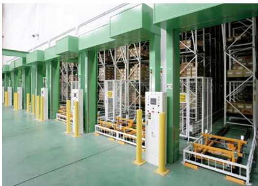
入庫側ステーション