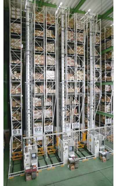
パレット自動倉庫