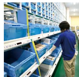
デジタルピッキングシステム