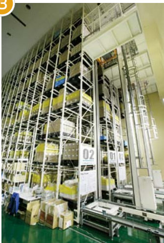
流通加工・二次検品前 一時保管