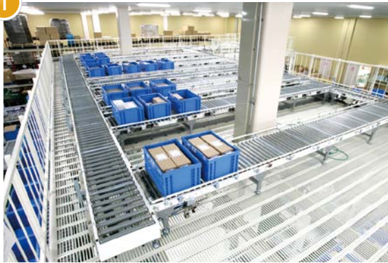
出荷検品・梱包前 整列・待機ライン