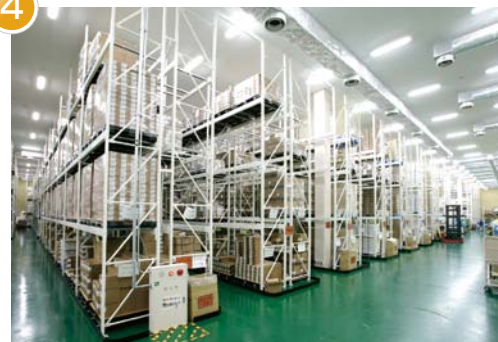
リザーブ品保管・ピッキングエリア