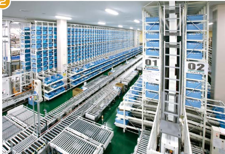
アクティブ品(高頻度)ピッキングエリア