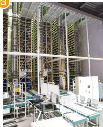
1F 入庫用 ワークステーション