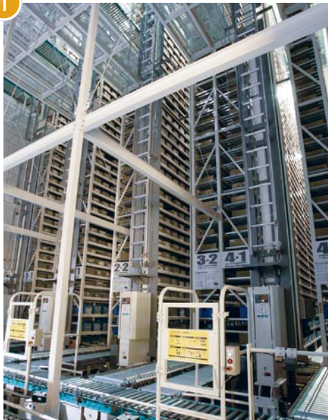
ケース用自動倉庫(フリーポジションタイプ)