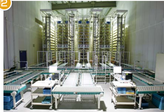
2F 出庫・再入庫用 ワークステーション