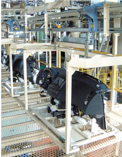
ライン上で一時バッファが可能

工程間搬送に威力を発揮するOCSツイントラックシステム。クリーンで静かな搬送を実現しています。