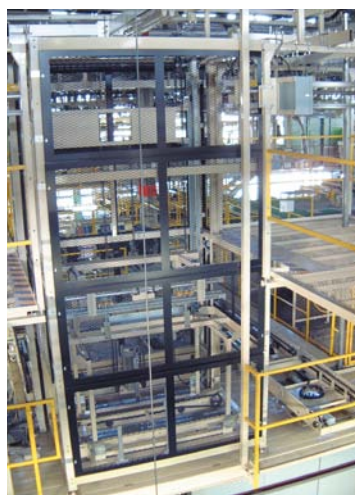
上下搬送にリフターを活用