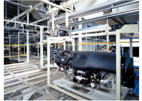
カーブ搬送も自由自在