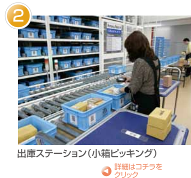
2 出庫ステーション(小箱ピッキング) 詳細はコチラをクリック