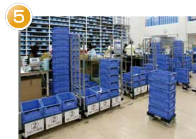
5 バラ品仕上げ用オリコンエリア