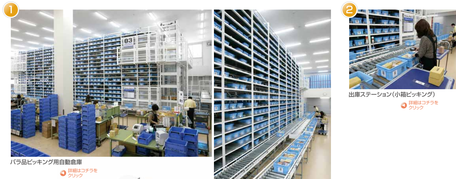
1 バラ品ピッキング用自動倉庫 詳細はコチラをクリック

60万種のアイテムを扱うネジ商社最大手の物流センター。 多段式独立水平回転棚「ロータリーラックH」を導入し、バラ単位のピッキング作業の省力化・高速化と省スペース化を実現しました。