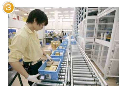
3 再入庫ステーション(小箱戻し入れ) 詳細はコチラをクリック