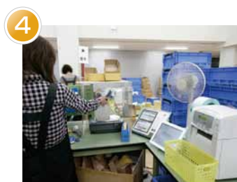
4 バラ品ピッキング・梱包 (小箱からネジ1本単位でピッキング)