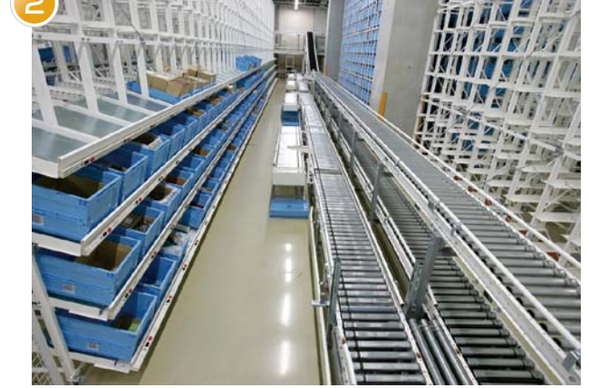
デジタルピッキングエリア