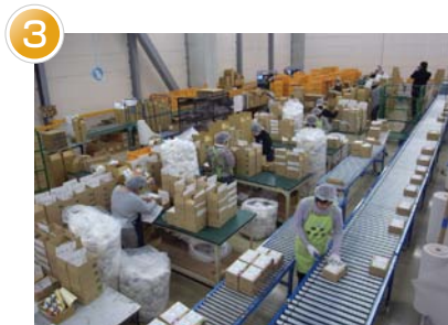
検品・梱包エリア