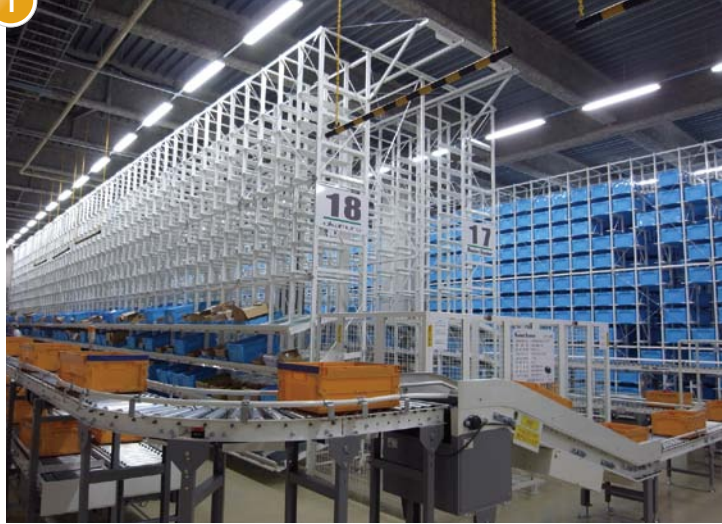
ピッキング用自動倉庫

Web通販に対応した24時間・365日稼働のオートメーション化された倉庫システム。宅配便ターミナルと直結したセンターで、迅速な配達を可能にしました。高速自動倉庫によりトータルピッキング、補充作業の無人化を実現。ピッキング間口はアイテムをフレキシブルに設定でき、複数の得意先の商品を同時に扱うことができます。