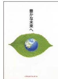
環境パンフレット「豊かな未来へ」