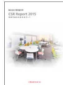
[CSR Report 2015]