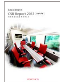
[CSR Report 2012]