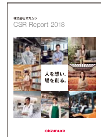
[CSR Report 2018]